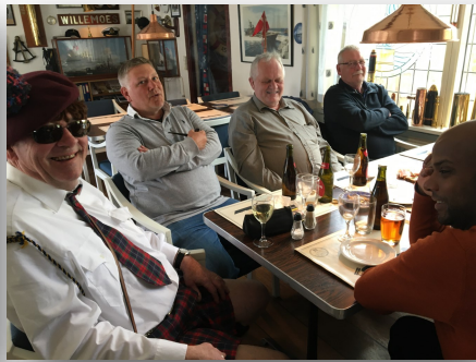
og slås mave